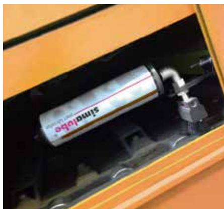
リサイクルプラントのコンベアーチェーンへのシマルーベ250 取付例 ブラシでチェーンのクリーニングも実施