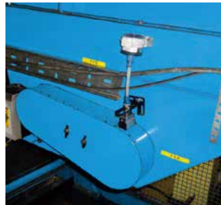
空港の荷物用コンベアー 取付例 シマルーベによりカバーを開けてのメンテが不要になった事例