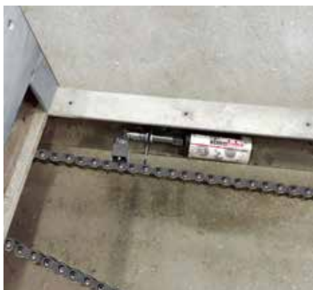
狭いスペースにオプションパーツを使用してシマルーベ125を設置している例