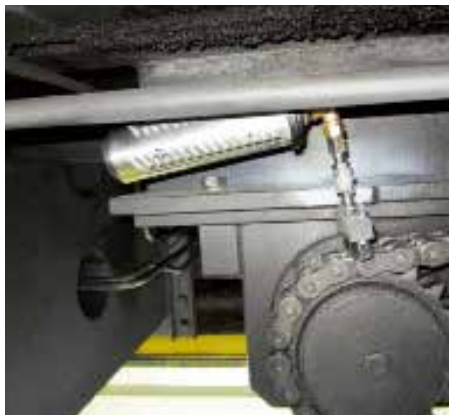
クレーンのドライブチェーンへのシマルーベ250 取付例

シマルーベはあらゆる工場のチェーン潤滑に使用されています。 シマルーベの連続的な潤滑により、機械の故障を未然に防ぐことができます。 シマルーベは危険な場所や届きにくい場所に最適です。 最長一年間チェーンや sprocket が潤滑されます。 専用ブラシと一緒に使用する事により、チェーンの汚れをクリーニングする 効果も見込めます。