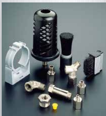
豊富なオプションパーツ