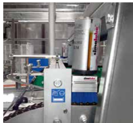
ビール工場におけるシマルーベ125とブラシ 取付例