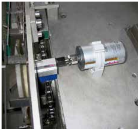
食品機械へのシマルーベ125とブラシ 取付例