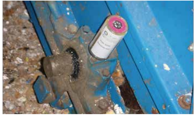
◆ 製紙工場 コンベヤー