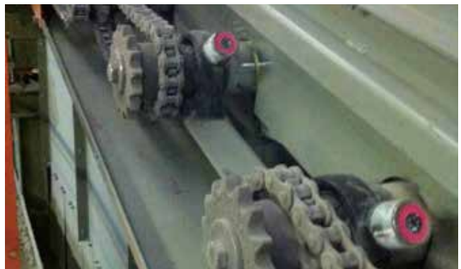
◆ リサイクルプラント チェーンコンベヤー