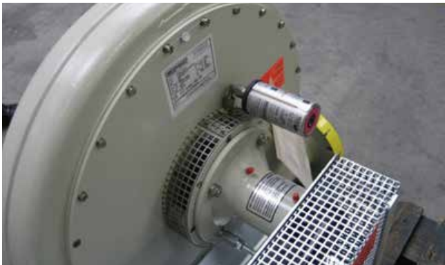
◆ ビル空調用給排気ファン