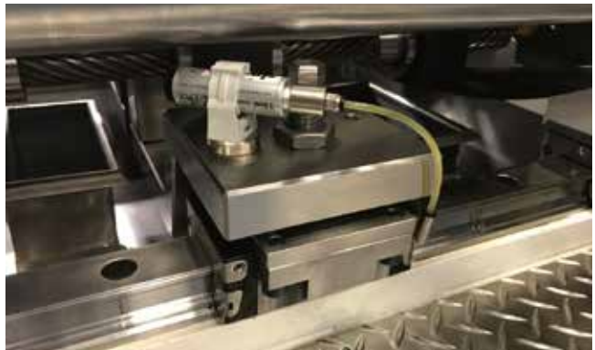
◆ リニアガイド(シマルーベ15)