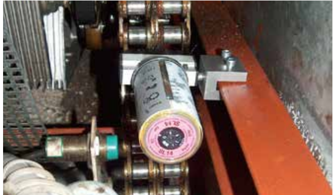
◆ エスカレーターチェーン(オイル仕様)