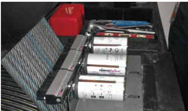
◆ ワイヤロープ(オイル仕様)